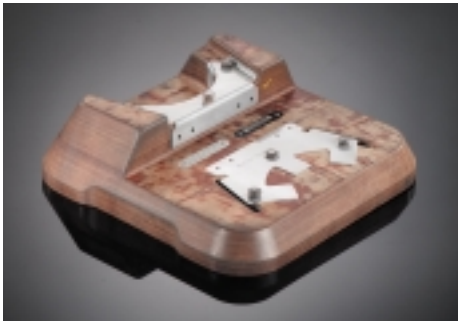
Airbus - Werkzeug 360 x 360