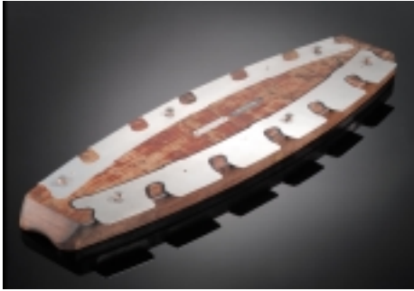
Airbus - Langes Werkzeug 880 x 250