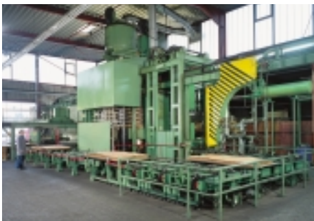
5000 to Presse